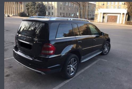
MERCEDES CL, 2010 год

Автомобиль был выкуплен за 4 000 000 руб.