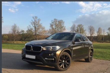
BMW X6, 2015 год

Автомобиль был выкуплен за 2 600 000 руб.