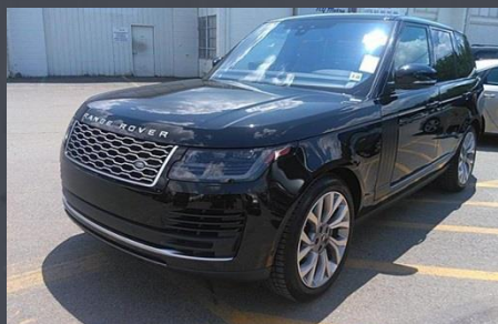
RANGE ROVER, 2017 год

Автомобиль был выкуплен за 2 600 000 руб.