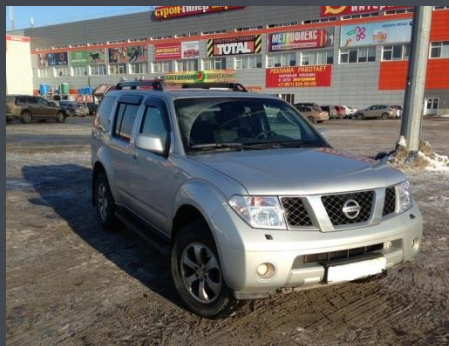
Nissan Pathfinder 2006 год