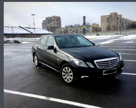
Mercedes-Benz 2009 год