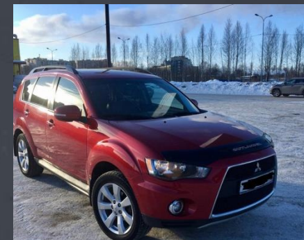
Mitsubishi 2011 год