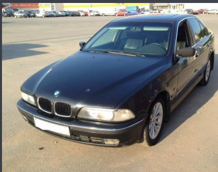
BMW 520 i 1998 год