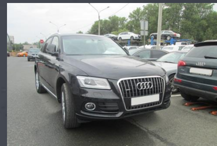
AUDI Q5, 2009 год

Автомобиль был выкуплен за 3 300 000 руб.