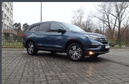
HONDA PILOT, 2018 год

Автомобиль был выкуплен за 3 300 000 руб.