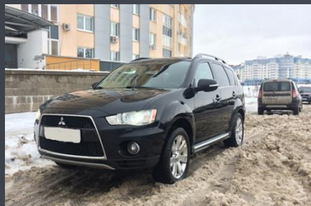
Mitsubishi, 2011 год