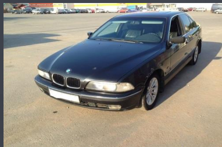
BMW 520 i 1998 год