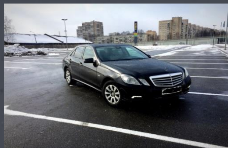
Mercedes E, 2009 год