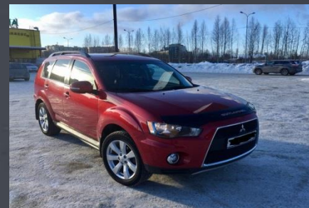
Mitsubishi, 2011 год