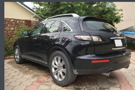
INFINITI FX35, 2007 год