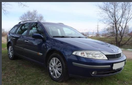
RENAULT, 2002 год