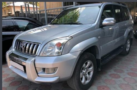
TOYOTA PRADO 2007 год